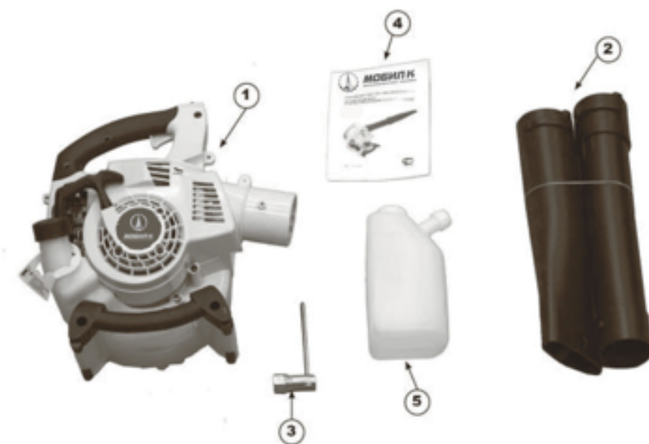
1. Двигатель 2. Труба воздушная 3. Ключ 4. Руководство пользователя 5. Емкость для приготовления топливной смеси